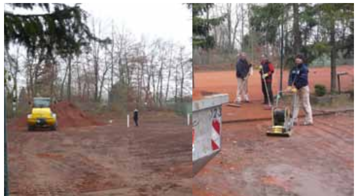
Beginn der Arbeiten