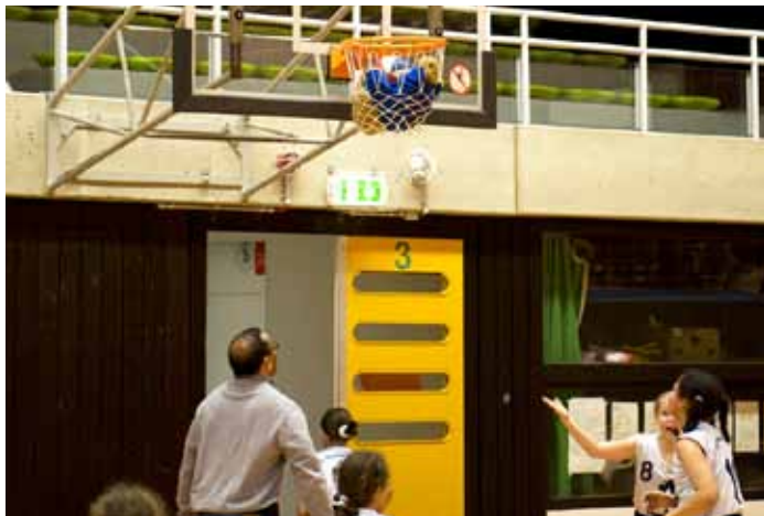
Wie kommt denn das Maskottchen in den Korb?