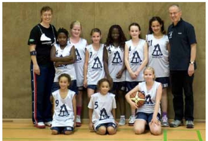
Ein starkes Team - inzwischen sind es schon doppelt so viele Spielerinnen!