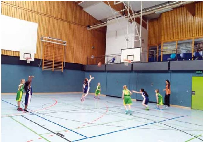
Oben: W10 beim Spiel gegen Wedel