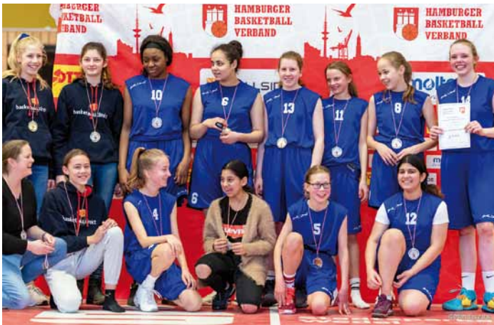
Hamburger Vizemeister W14