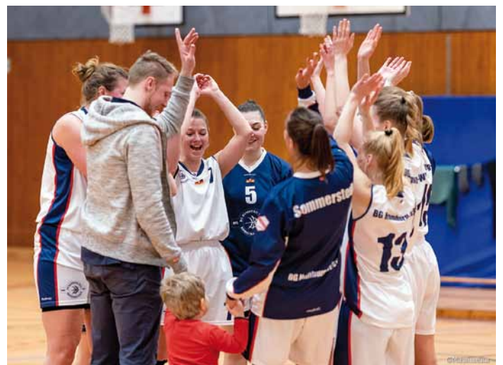
Die ersten Damen feiern die Meisterschaft in der 2. Regionalliga