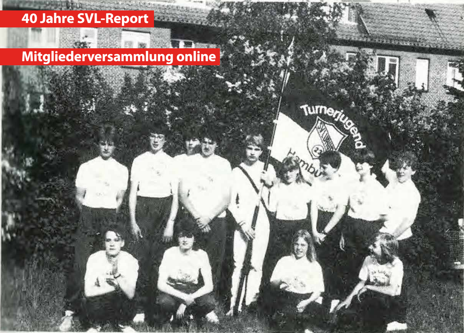
SVL-Turnerjugend beim 8. Landesturnfest in Itzehoe