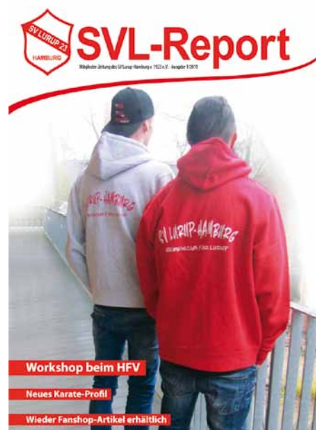
Aktueller Entwurf mit neuem Kopf und Übersicht der Sportangebote im Mittelteil. Erstellt von Nele Herbst-Kirsten

Hallo liebe Mitglieder des SV Lurup, Hallo liebe Leser des SVL Reports,