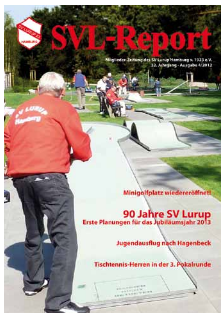
Neuer Titel und flächendeckendes Titelbild. Im Innenteil alles in Farbe. Erstellt von Nele Herbst-Kirsten